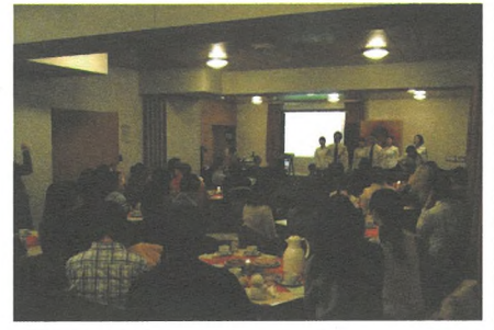
廣大的留學生禾場

此外，哥廷根是個小鎮，這裡的華人團體不多，華人若遇到生活上的問題，很難找到可以並願意幫助他們的對象。我們認識一位中年女士，因丈夫有了婚外情，並和情婦生下小孩，所以被逼要離婚。她二十年前跟丈夫來德，為了讓丈夫的學業與事業有所發展，放棄了自己的事業，專心在家中看孩子，煮飯，洗衣等來支持丈夫。兒子現已28歲，卻被丈夫拋棄，無依無靠，又不懂德語。另有一位同學，早年因憂郁症而學業受到影響，終被停學。因學業未成，又不敢回家，所以在德流離，終被遣回國。他欠了同學及朋友的錢，病沒治好而學業未成，回國後前途一片迷惘。