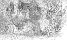
圖一：猶太人的曆法