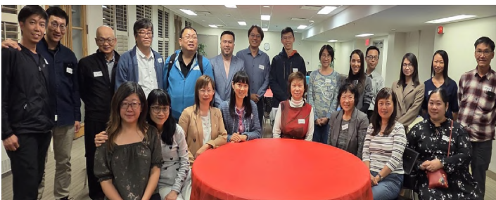
牧者全人健康大搜查

(3) 近年有20 多位香港移民，入讀天道神學院。為了 關顧華人神學生，中心於去年10月19日舉辦感恩 節晚餐及「牧者全人健康大搜查」，交流活動，提 供資訊。有23位出席。